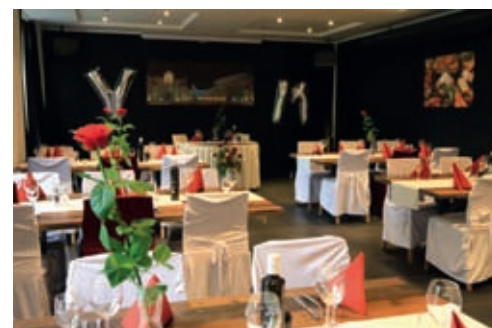
Der neu gestaltete Festraum bietet ausreichend Platz