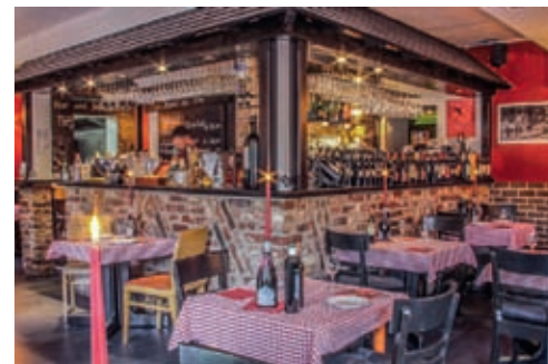
Ein Blick in den gemütlichen Gasträum der Trattoria