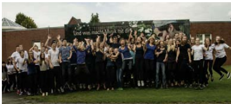
Das Landesjugendorchester NRW und der Mädchen- und Knabenchor des Kölner Doms. Termin: 27. Juni 2017