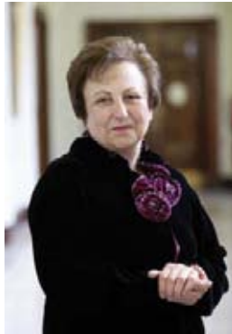
Dr. Shirin Ebadi 10. Mai bis 16. Mai 2017, verschiedene Termine

Im Laufe der Woche werden die Friedensnobelpreisträgerinnen zahlreiche interne Workshops und Treffen durchführen, sich mit anderen Persönlichkeiten austauschen, Sightseeing-Touren unternehmen und am Abend des 15. Mai 2017 zu ihrem Publikum in der Kaiser-Friedrich-Halle bei der Veranstaltung „Nobelpreisträger in Mönchengladbach“ sprechen. Die Nobel Women's Initiative zielt darauf ab, den Bekanntheitsgrad des Preises und den der einzelnen Mitglieder zu nutzen, um den Einfluss von Frauengruppen auf der ganzen Welt, die sich für Frieden, Gerechtigkeit und Gleichheit einsetzen, zu stärken und ihre Anliegen in der Wahrnehmung der Öffentlichkeit zu steigern. Bislang haben ihr Kommen schon fest zugesagt: Shirin Ebadi, Mairead Maguire, Tawakkol Karman.