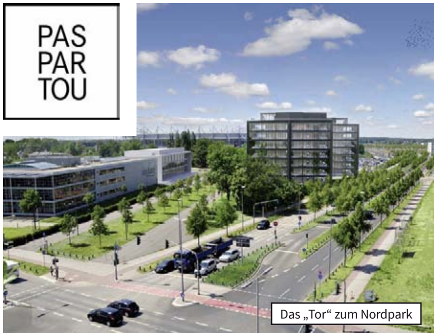
Das „Tor“ zum Nordpark