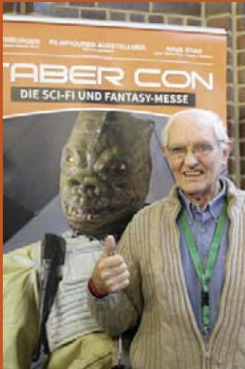
Alan Harris Bossk (Star Wars)