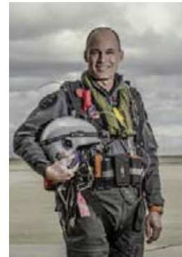
Dr. Bertrand Piccard, Termin: 27. Juni 2017.